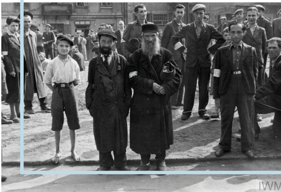
Dans l'enceinte du ghetto de Varsovie, Pologne, 1941. Imperial War Museums, HU 60662.