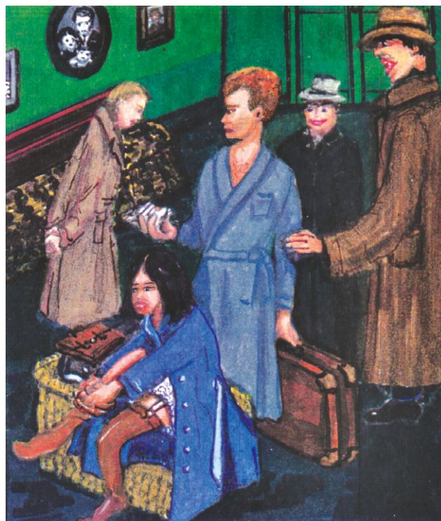
Illustrations de Marguerite Élias Quddus.