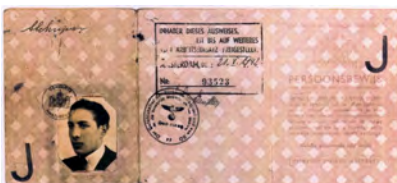
Carte d'identité, Pays-Bas, 1941