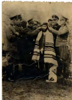
Photographie, Pologne, 1943